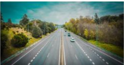
Vaikuttamista edustusten kautta