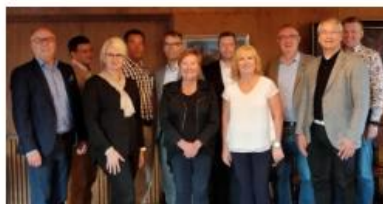
Hyvän hallinnon toteuttaminen