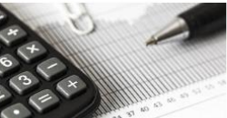
Tuloslaskelma ja tase 2019