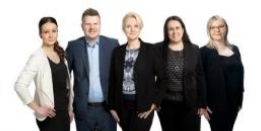
Kauppakamarin toimisto ja viestintä