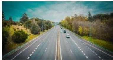
Vaikuttamista edustusten kautta