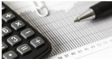
Tuloslaskelma ja tase 2019