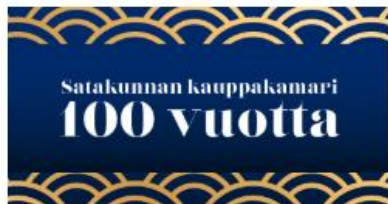
Juhlavuoden tapahtumia ja nostoja