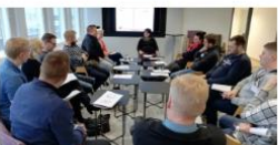
Satakunta Business Campus (BC)