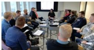
Satakunta Business Campus (SBC)