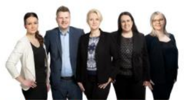
Kauppakamarin toimisto ja viestintä