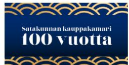
Juhlavuoden tapahtumia ja nostoja