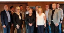
Hyvän hallinnon toteuttaminen